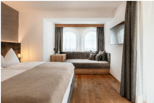
Deluxe per 2-3 persone