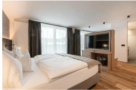
Junior Suite per 3-4 persone