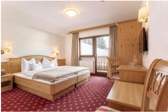
Comfort per 2 persone