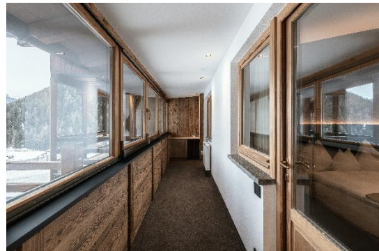
Family Room per 4 persone